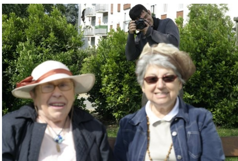
Laurent Neyssensas photographie deux des participantes

Quand nous observons une photo, nous ne pouvons pas nous rapporter seulement à l'image qu'elle reflète, car une photographie parle aussi de la personne qui l'a pris. Parfois même, dans une photographie nous pouvons extraire des regards différents (celle du photographe, du « photographié » et de l'appareil de photo) qui se confrontent sur le même support. Analyser les tensions qui existent dans une photographie peut aussi nous permettre de mieux appréhender l'instant fixé.