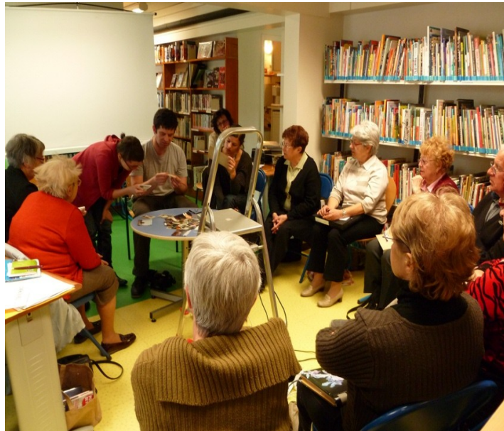
Atelier-découverte à la Bibliothèque du Breil-Malville

Pendant les deux ateliers précédant la résidence, nous avons créé un espace de dialogue et d'échange autour de la photographie. Les participants ont pu partager leurs opinions et leurs expériences, exprimé ce qu'ils trouvaient positif avec le développement de la photographie, mais aussi ce qu'elle aurait perdu dans l'avènement du numérique. Et ils avaient beaucoup des choses à dire ! En effet, ils ont vécu l'apparition des premières photos et toutes les évolutions techniques jusqu'à aujourd'hui.