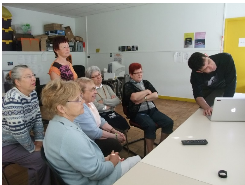
Atelier-création dans les locaux de PiNG