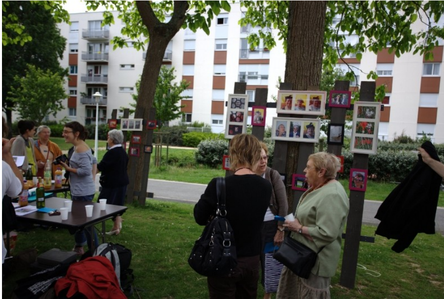
Vernissage en plein air, face au Pôle associatif du 38Breil

Le dernier jour, nous avons installé une exposition en plein air avec une sélection des photographies réalisées durant la semaine. Le fait de voir ces photos ensemble, décontextualisées et encadrées, transforme la manière dont on les regarde. Ce qui n'a pas été sans surprise pour les participants et le public, habitants du quartier ou visiteurs de passage.